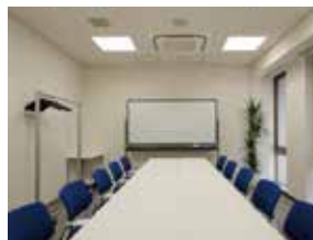
ミーティングルーム 1