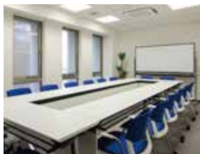
ミーティングルーム 2