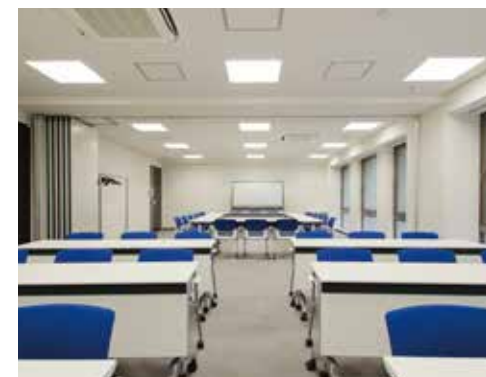
会議室 1+2 (パーティション無)